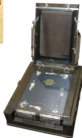
ガリ版の道具たち