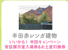
半田赤レンガ建物 いいかも! 半田キャンペーン 常設展示室入場券&お土産引換券