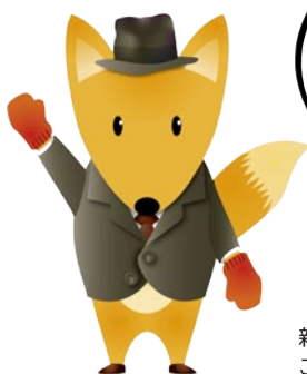
新美南吉童話イメージキャラクター ごん吉くん

先生おふたりへの質問は、 対談の中で答えてもらえる かもしれないよ！ ぜひ書いて送ってね♪