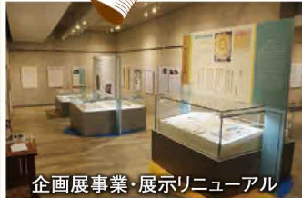
企画展事業・展示リニューアル