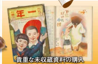
貴重な未収蔵資料の購入