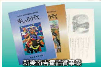
新美南吉童話賞事業